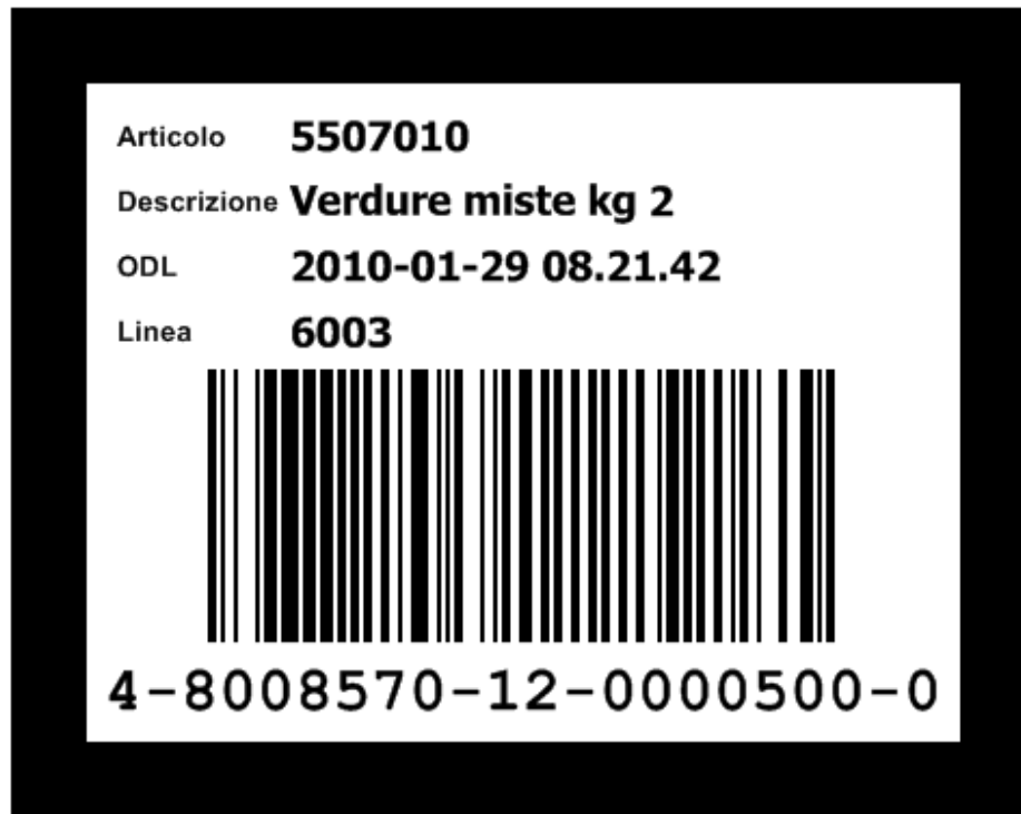
Figura 6 - Etichetta prepallet

Nel caso non sia operativo un pallettizzatore automatico sarà installata una postazione con stampante di etichette in formato A5: prima del processo di avvolgimento del pallet con la pellicola, si provvederà alla scansione dell'etichetta prepallet; il sistema provvederà a stampare 2 copie dell'etichetta A5 (SSCC) che verranno applicate ortogonalmente sul pallet, dopo che sarà stato avvolto con la pellicola.