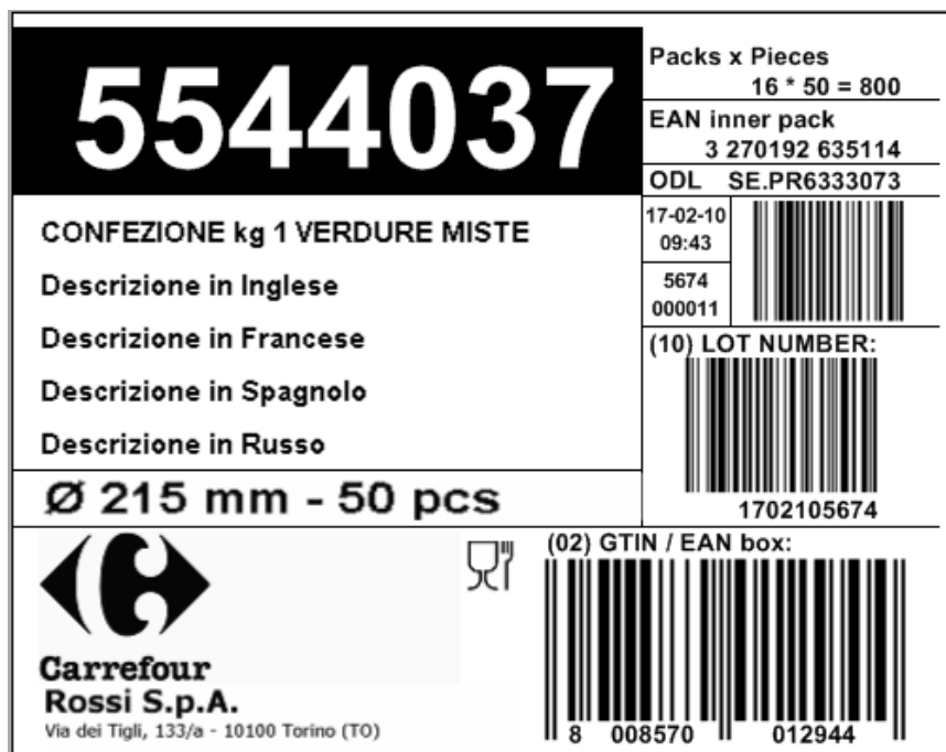
Figura 4 - Etichetta scatole

Tale processo ha lo scopo di applicare un'etichetta identificativa sulla scatola contenente le unità di vendita. L'etichettatura delle scatole deve essere realizzata alla fine del processo di imballaggio e quindi è solitamente integrata con una linea di produzione.