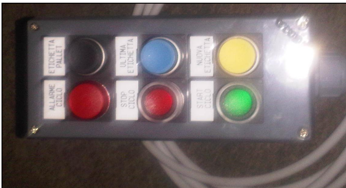
Figura 2 - Pulsantiera

Mentre sono presenti sul mercato sistemi stampante/applicatore appositamente progettati per l'etichettatura automatica, data la peculiarità delle funzionalità richieste, la DiploIOBox e la Pulsantiera sono state progettate e realizzate ad hoc; in questo modo, inoltre, è possibile apportare in corso d'opera eventuali modifiche o adattare gli stessi dispositivi a funzionalità diverse.