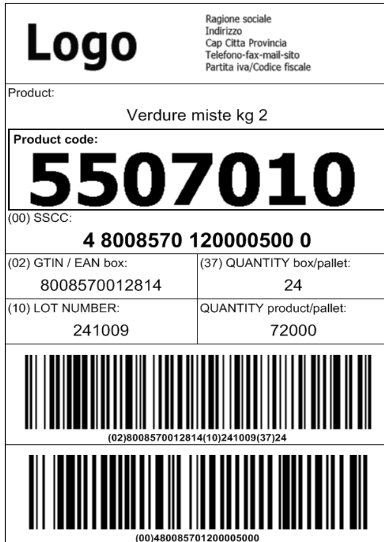
Figura 5 - Etichetta pallet (SSCC)

Se il processo automatico di pallettizzazione non è presente o è momentaneamente inutilizzabile, al fondo linea deve essere possibile stampare, con apposito pulsante, un'etichetta prepallet facilmente riconoscibile, ad esempio con un contorno nero (il sistema abbinerà al pallet appena formato le ultime n scatole prodotte).